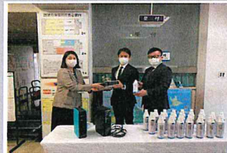
兵庫県西宮市保健所にて導入 地方自治体の医療体制を支援