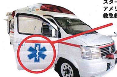
VIGO MEDICAL 社の酸素缶はこの救急救命認証を受けた唯一の酸素缶

スターオブライフとは、1973年にアメリカで生まれた世界が認める救急救命のシンボルマークです。