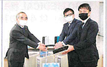
兵庫県姫路市保健所

コロナ疾患軽症者や自宅待機されている入院したくてもできない方々への貸し出しなどで導入にて少しでも症状緩和を実現できる酸素発生器として導入。