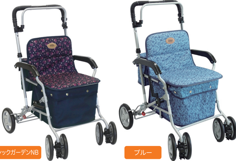
クラシックガーデンNB